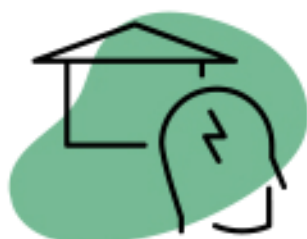
Dejar los problemas personales en casa