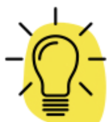
Ir siempre más allá