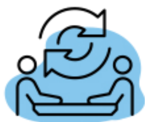
Ofrecer y solicitar ayuda

A continuación te comparto lo que normalmente se conocen como los hábitos de trabajo de la gente exitosa :