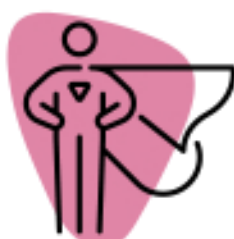
Ser una persona confiable