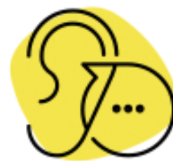
Aprender a escuchar