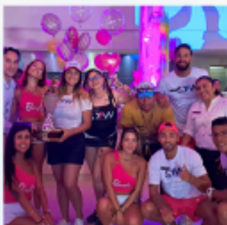
Entretenimiento Mejor Departamento