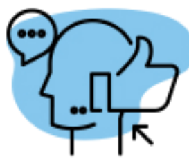
Aprender a aceptar críticas constructivas